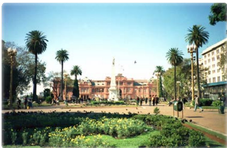
Plaza de Mayo e Casa Rosada

A Viveenbuenosaires.com ® proporciona aos seus assessorados a possibilidade de conhecer uma das cidades mais lindas e importantes da América Latina, se você já estava planejando sua viagem a Buenos Aires, não se preocupe, nós já programamos para que você não perca um segundo de sua estadia em Buenos Aires, e esteja tranqüilo para desfrutar a capital Argentina.